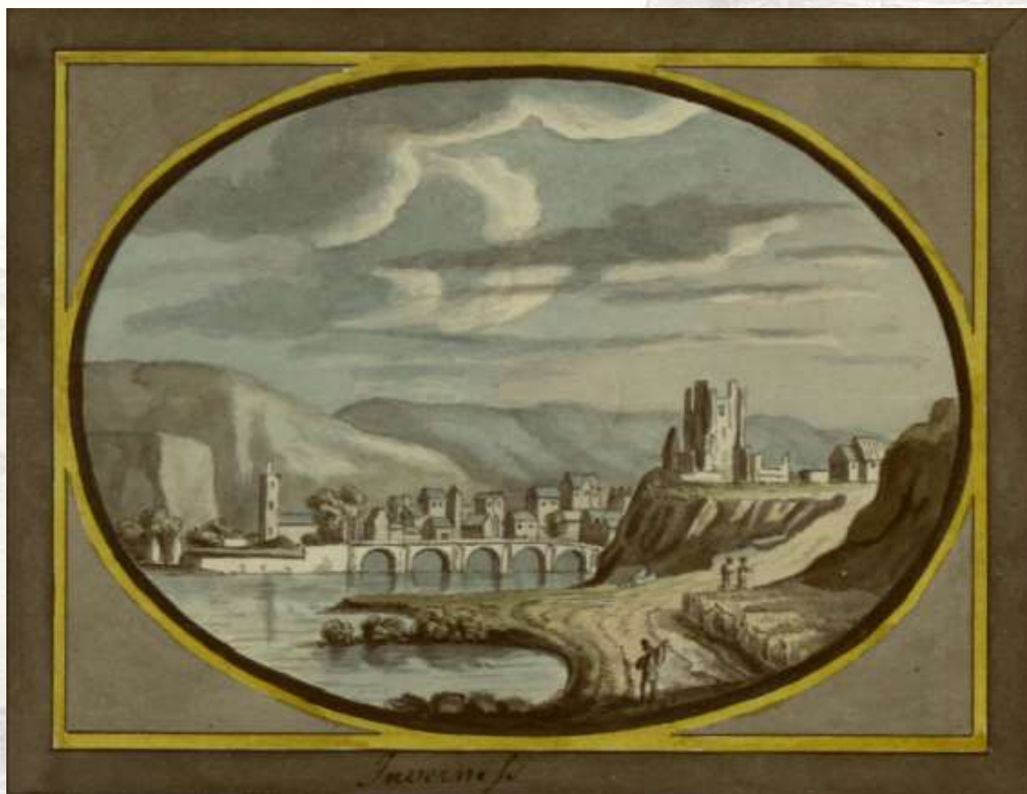
THE CASTLE OF INVERNESS.

Una producción de Teatro del Astillero a partir de La tragedia de Macbeth